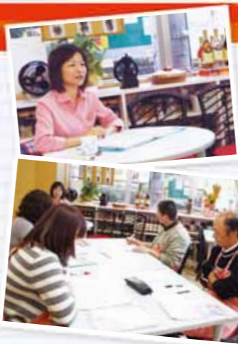
真剣な面持ちで講義に聞き入る生徒たち

まずは『繁盛店になるお店作り・再来店させる店作りについて』の講義を行います。カフェでのさまざまなシチュエーションに対して学園長からの適切な解説やアドバイスが講義されます。