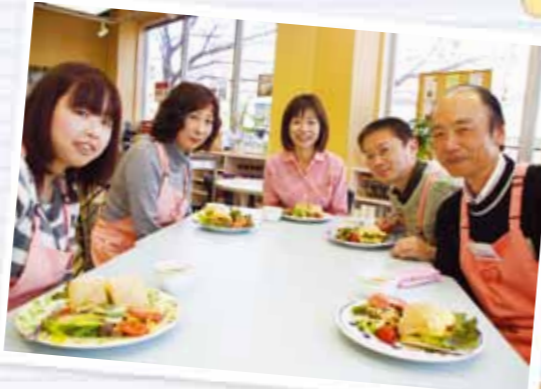
それではみんなていただきます～!

今回の実習メニューは「チャバタサンドときのこと木の実のサラダ」。アナナスジャパンさんの冷凍パンを使って調理しました。