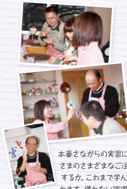
冷や汗をかきつつ奮闘する生徒たち

続いては、カフェオーナーとお客さん役に別れて、実際の接客サービス、調理の実習です。お客さまに心地よく過ごしていただくための接客サービスを上手く実践できるでしょうか!?