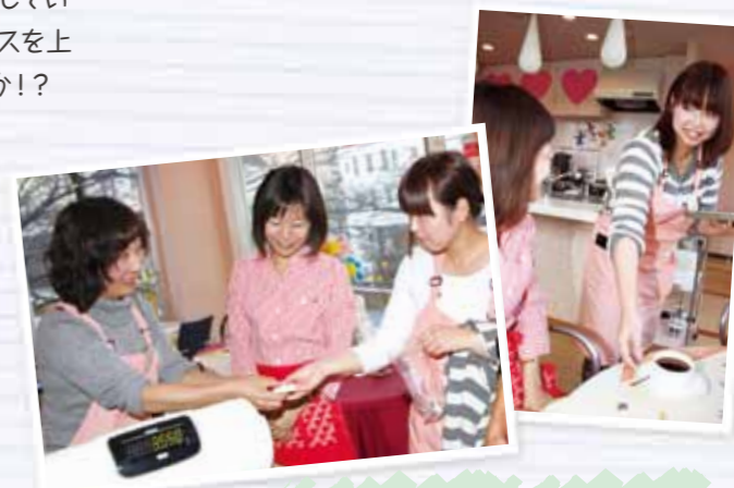
お会計を済ませてひと安心。上手にできたかな?

本番さながらの実習にみなさん悪戦苦闘。お客さまのさまざまなご注文をいかに効率よく提供するか。これまで学んできた知識と技術が試されます。慣れない調理と接客に戸惑う場面もしばしば。知識だけでは現場はこなせないことを実感!?