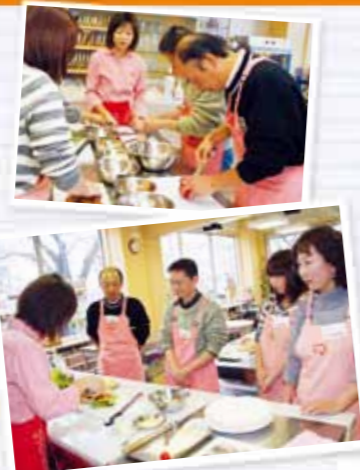
お昼ごはんも兼ねて調理実習が行なわれます。今日のメニューは・・・

Lesson2はお昼ご飯作りも兼ねた調理実習。限られた時間の中でいかに効率良く、美味しく調理できるかが問われます。ここでも、調理のコツやお金が頂ける盛りつけ方などの確にアドバイス。みんな上手にできたかな!?